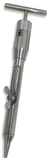
ケーブルテンショナー