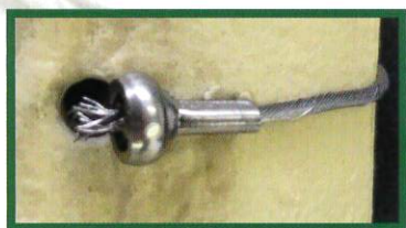
極小可動式クリンプ