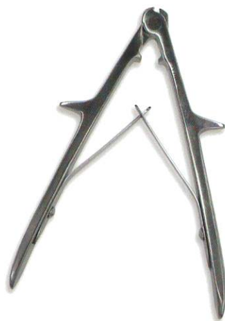
ケーブルカッター